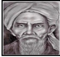
Gambar 3 : Tok Janggut

3. Gambar 3 dan Gambar 4 menunjukkan pemimpin tempatan yang menentang British di Kelantan dan Terengganu.