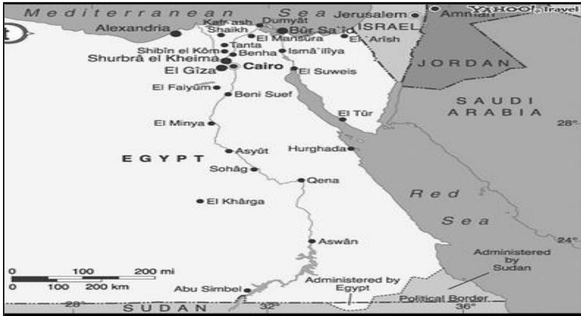
Peta 1 : Tamadun Mesir Purba