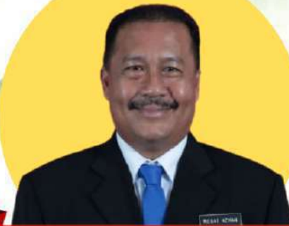
EN. MEGAT MUHAMMAD AZHAN BIN MEGAT RAFIE PENOLONG PENGARAH SAINS SOSIAL