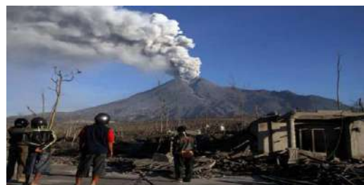
Letusan gunung berapi