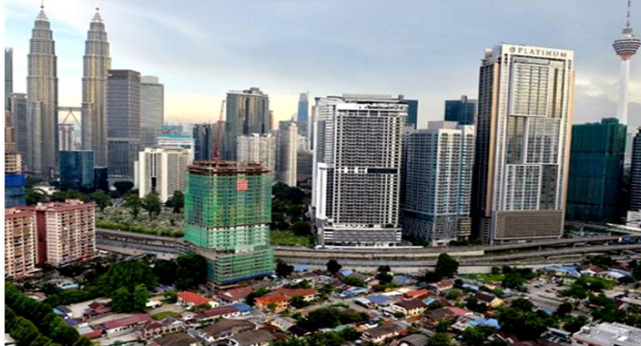
Kemajuan dan pembangunan negara sangat bergantung kepada kefahaman rakyat terhadap konsep integriti dan integrasi serta amalan mereka yang berkaitan.(Gambar hiasan)

Oleh DR ANIS YUSAL YUSOFF 10 Februari 2022 09:03am | Masa membaca: 4 minit