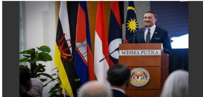
Hishammuddin berkata pencapaian PBB selama ini mesti dijadikan inspirasi oleh semua negara untuk bersama-sama memetakan hala tuju, menentukan masa depan dunia yang lebih baik terutama di era pasca pandemik.

Hishammuddin Hussein Oktober 24, 2020 10:17 MYT