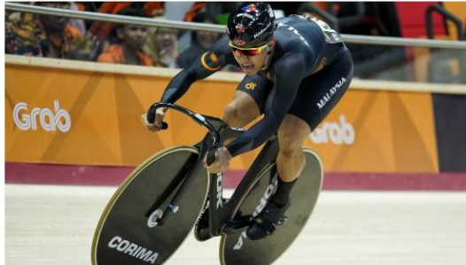
Azizulhasni pertama dunia acara keirin by Afiz Reduan © January 22, 2020 10:30 am