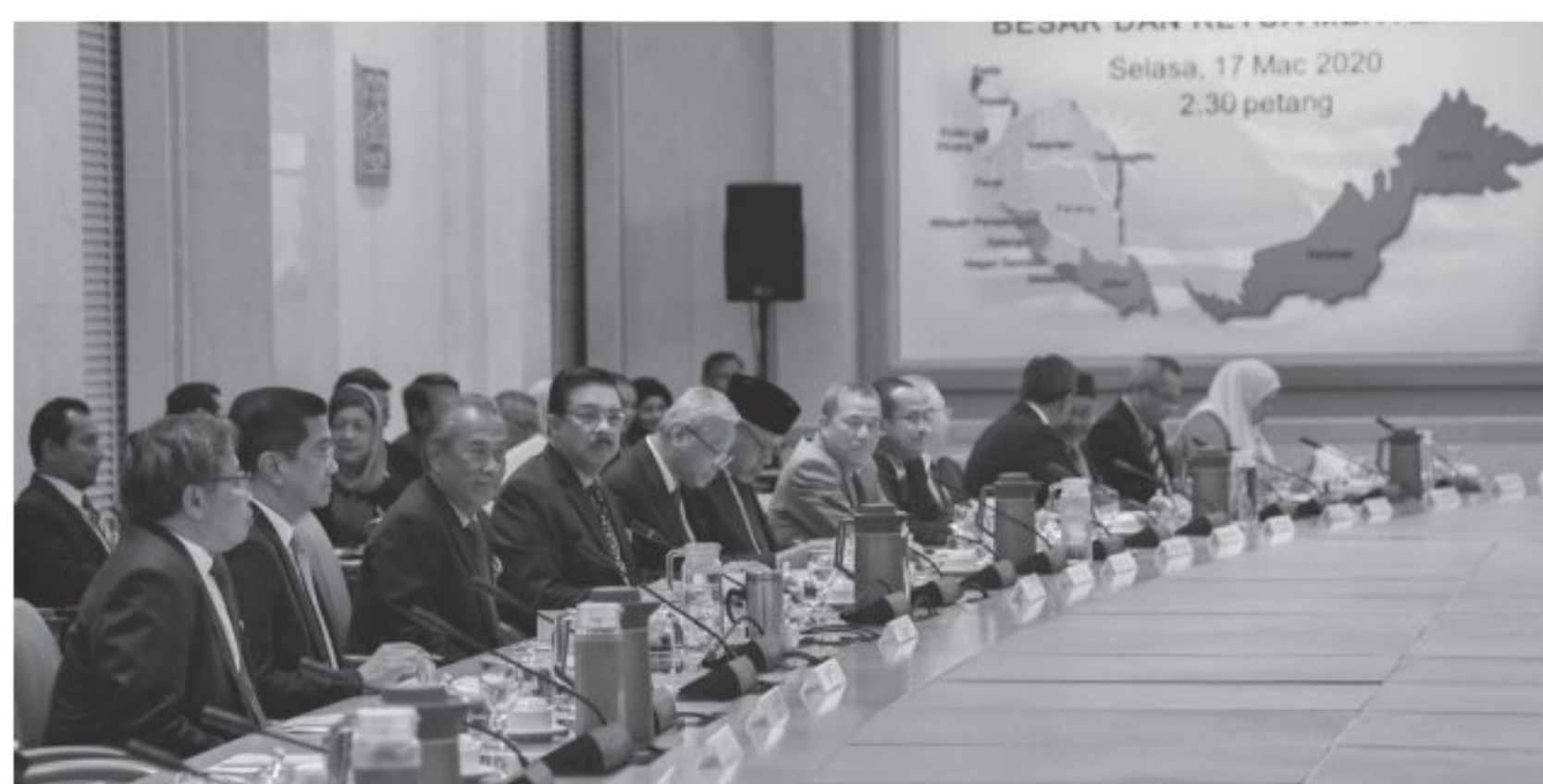
Sumber: Bernama, 17 Mac 2020

28 Gambar berikut menunjukkan suasana mesyuarat Menteri Besar dan Ketua Menteri.