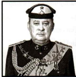
Kebawah Duli Yang Maha Mulia Seri Paduka Baginda Yang di-Pertuan Agong Sultan Ibrahim

25 Gambar berikut adalah Yang di-Pertuan Agong Malaysia ke-17.