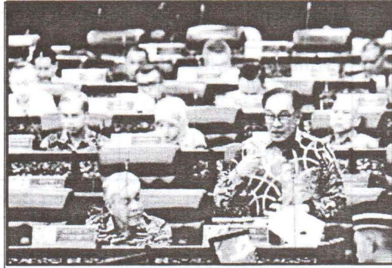
Perbahasan usul kerajaan