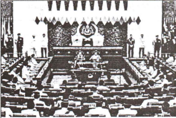
Perasmian persidangan oleh Yang di-Pertuan Agong ke-XVII

(c) Gambar berikut menunjukkan persidangan anggota Dewan Rakyat.