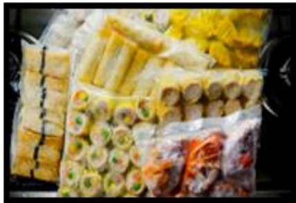
PRODUK SEJUK BEKU RM 1.3 JUTA