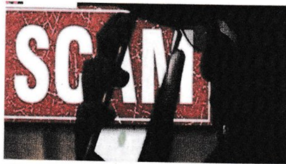
Bermacam-macam kes penipuan dalam talian yang bertmbun dilaporkan, antaranya Macau Scam, penipuan pinjaman, pelaburan, Love Scam dan seumpamanya.

3. Gambar di bawah berkaitan dengan kes penipuan dalam talian yang sering disiarkan di media massa.