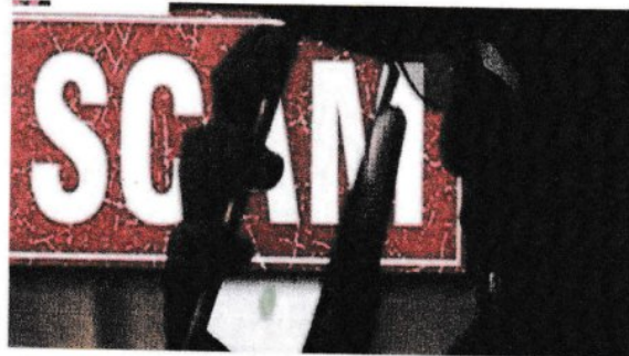
Berbagai-macam kes penipuan dalam talian yang bertmbun dilaporkan, antaranya Macau Scam, penipuan pinjaman, pelaburan, Love Scam dan seumpamanya.

3. Gambar di bawah berkaitan dengan kes penipuan dalam talian yang sering disiarkan di media massa.