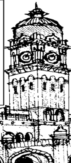
Bangunan Sultan Abdul Samad, Kuala Lumpur

SHAH ALAM : Bangunan bersejarah merupakan bangunan yang wajar dipelihara. Sultan Selangor Sultan Sharafuddin Idris Shah telah bertitah agar pihak berkuasa melaksanakan pemuliharaan dan pemeliharaan bangunan bersejarah di Malaysia. Menurut baginda, kebanyakan bangunan bersejarah berpotensi untuk menjadi tumpuan pelancong dari dalam dan luar negara.