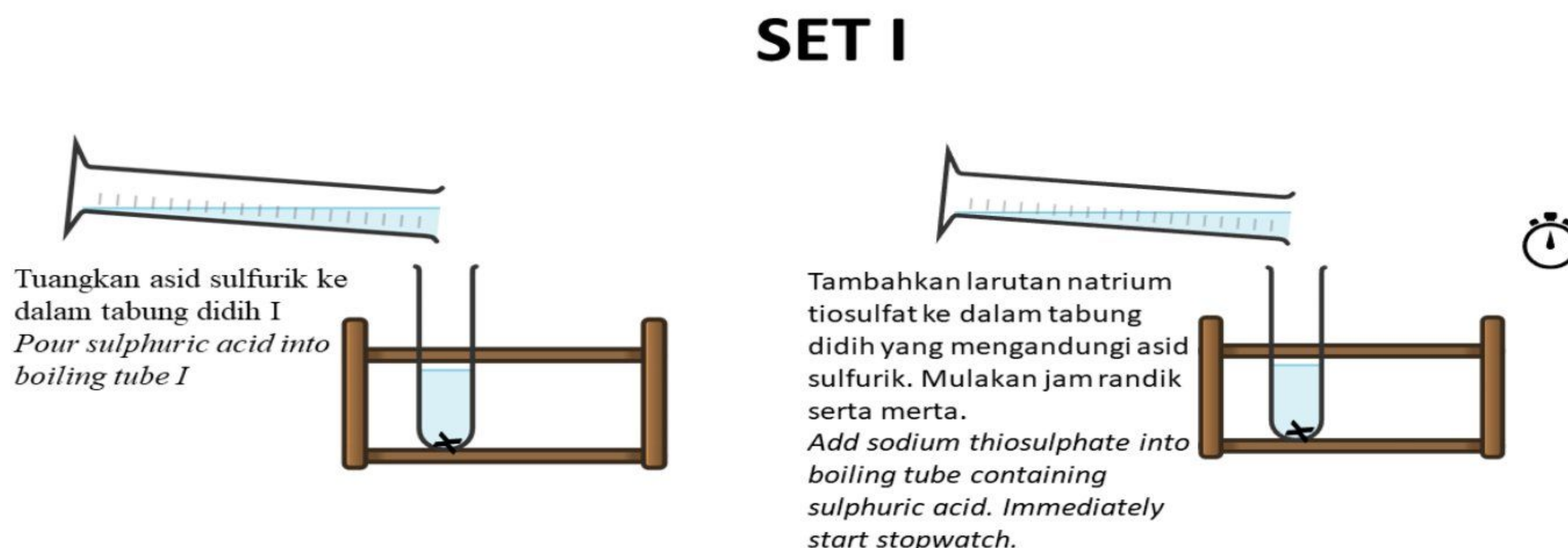
Rajah 1 Diagram 1

Diagram 1 shows apparatus set up to determine the rate of reaction between sodium thiosulphate solution and sulphuric acid for set I.