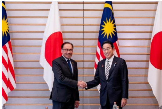
“Malaysia-Jepun fokus perbanyak kerjasama ekonomi” Facebook : YAB Datuk Seri Anwar Ibrahim