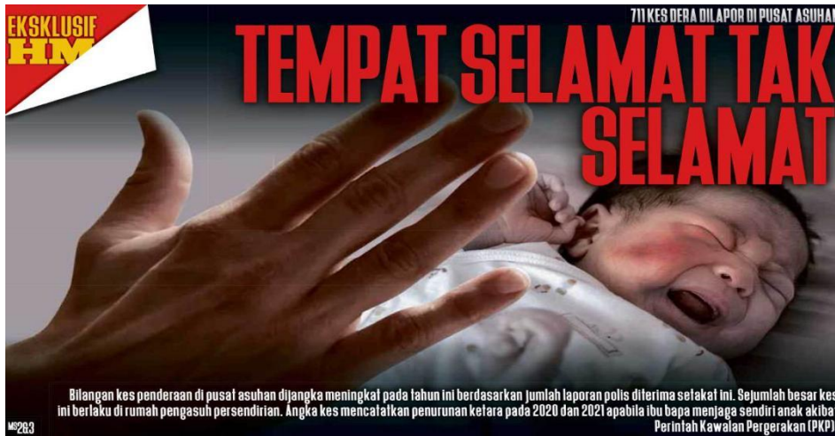
LAPORAN muka depan Harian Metro, 28 Mei 2022.

4. Maklumat berikut berkaitan kes penderaan kanak-kanak di pusat asuhan.