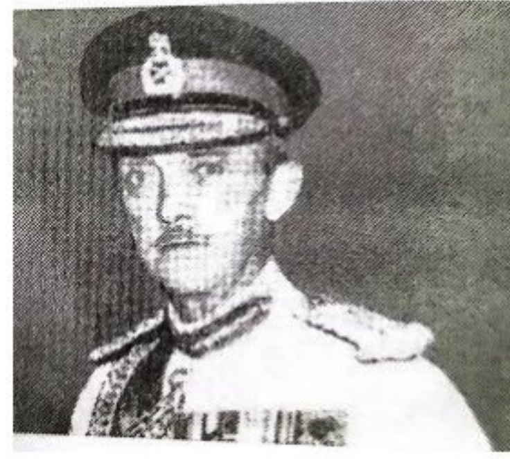
Sir Gerald Templer

12 Tokoh berikut telah melancarkan kempen “Memenangi Hati dan Fikiran Rakyat”