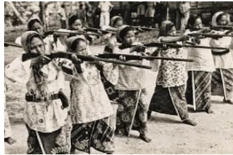
Pasukan Home Guard