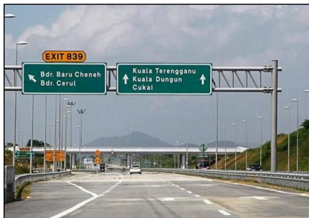
Lebuhraya Pantai Timur 2