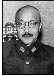
Jeneral Hideki Tojo