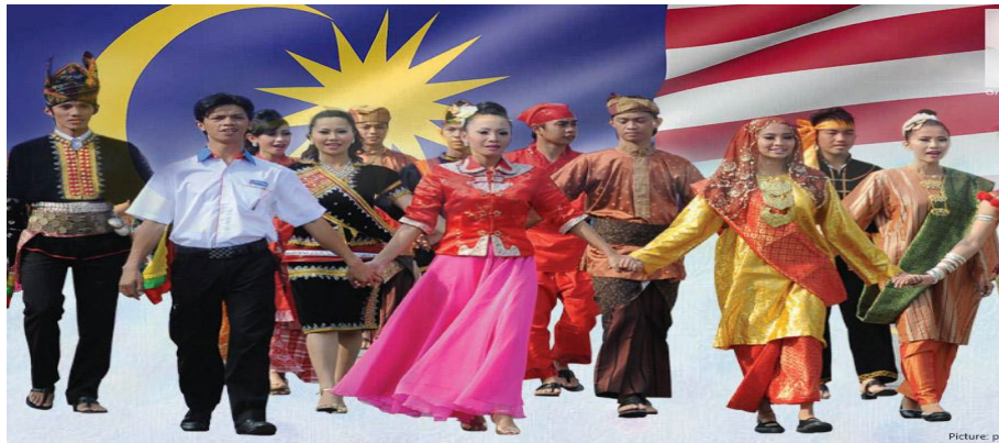
Rajah 1 : Keharmonian kepelbagaian kaum di Malaysia