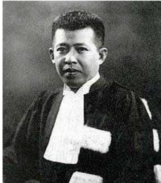
Nai Pridi Phanomyong

Gambar berikut menunjukkan tokoh nasionalis yang telah membawa perkembangan nasionalisme di Thailand.