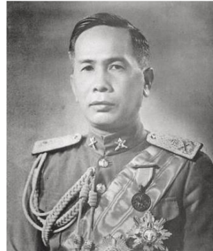
Field Marsha Phibulsongkram