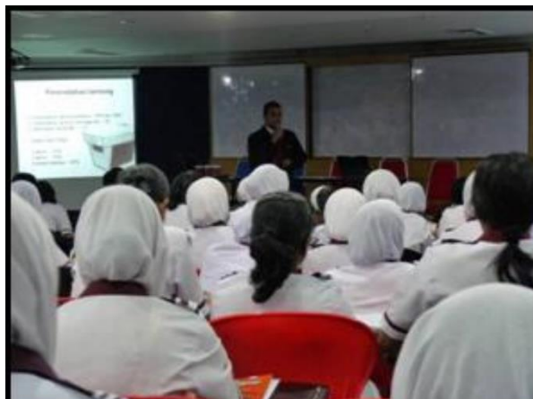
Pameran pendermaan organ dan pendaftaran pendermaan organ sempena sambutan Hari Buah Pinggang Sedunia Peringkat Kebangsaan di Hospital Serdang, Selangor.